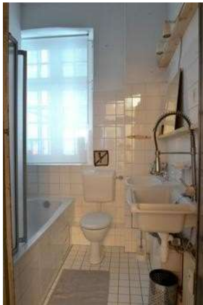
La salle de bain (utilisation partagée)