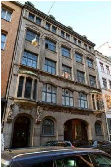
La rue | L'entrée | Façade Est